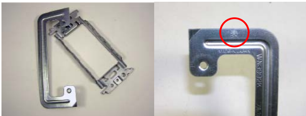
「表」のマーキング がついています。