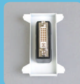
中継コネクタタイプ