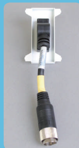
ケーブル付きタイプ