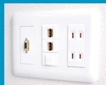
パナソニック電工社製3連コンセントプレートWTF7009Wへの取付例