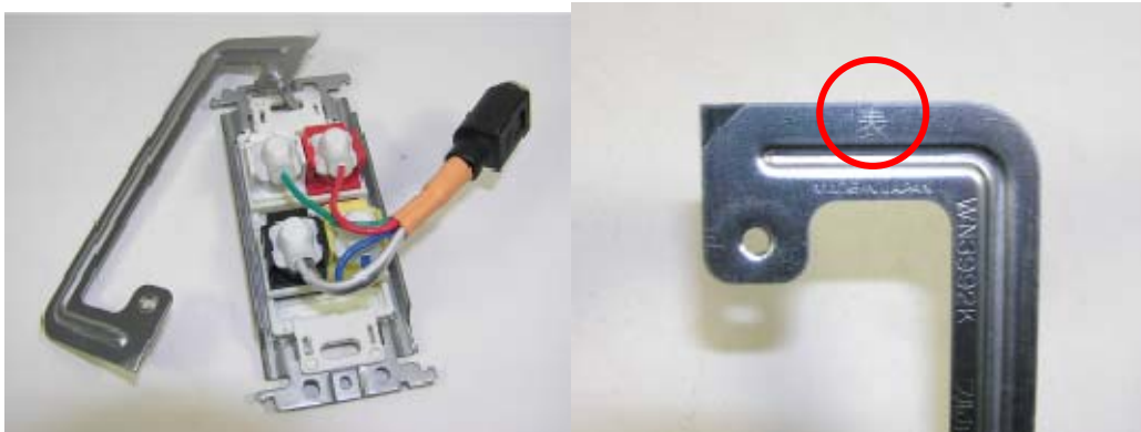
「表」のマーキング がついています。